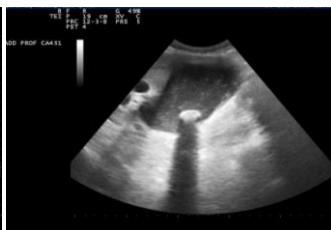
Calcolosi della Colecisti